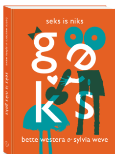
Tekst: Bette Westera Illustraties: Sylvia Weve